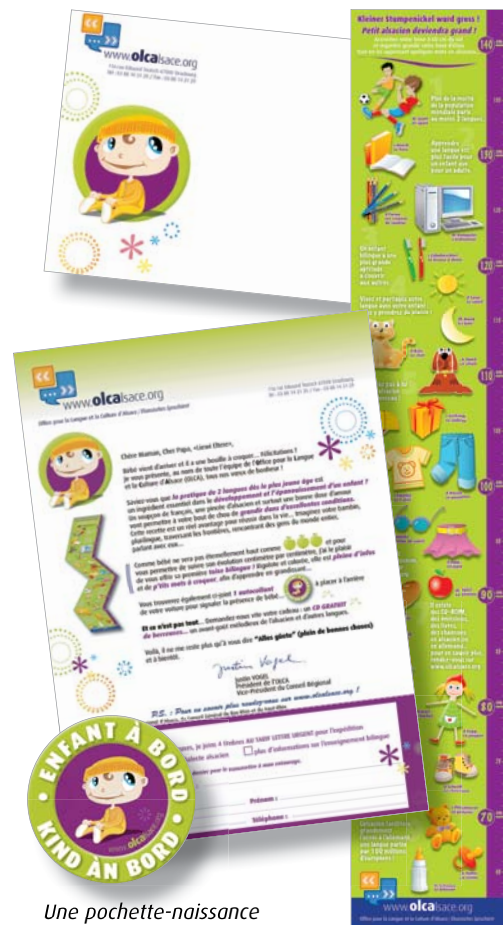
Une pochette-naissance contenant des conseils pratiques pour une éducation bilingue

Vous souhaitez faciliter l'échange quotidien et professionnel en alsacien dans votre collectivité, votre entreprise, votre association... vous trouverez à l'OLCA un appui et des conseils, pour monter un plan de formation et de financement.