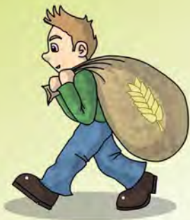
Illustration J. Mourer-art

D'autres comptines et jeux de doigts en alsacien sur www.olcalsace.org