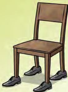
Illustration J. Mourer-art

D'autres comptines et jeux de doigts en alsacien sur www.olcalsace.org