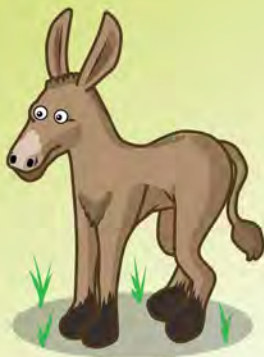
Illustration J. Mourer-art

D'autres comptines et jeux de doigts en alsacien sur www.olcalsace.org