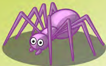
Illustration J. Mourer-art

Es isch emol gsinn E Steckel ùn e Spinn Es isch emol gewan E Steckel ùn e Span Es isch emol gewase E Steckel ùn e Base De Base het gekràcht Ùn d'Spinn het gelàcht Hahaha !