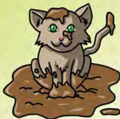
Illustration J. Mourer-art

D'autres comptines et jeux de doigts en alsacien sur www.olcalsace.org