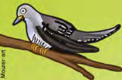
Illustration J. Mourer-art

Guguck im Tànnewàld Wieviel Johr bin ich àlt? Guguck im Rëweloch Wieviel Johr lëw ich noch?