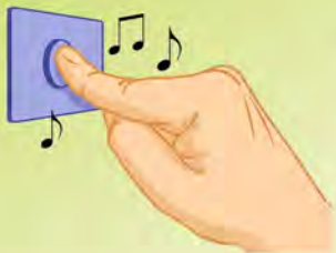
Illustration J. Mourer-art

D'autres comptines et jeux de doigts en alsacien sur www.olcalsace.org